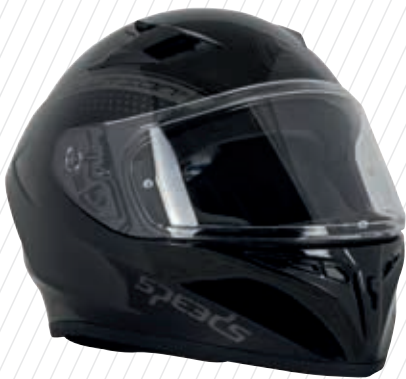
GRAPHIC ROT SCHWARZ GLÄNZEND