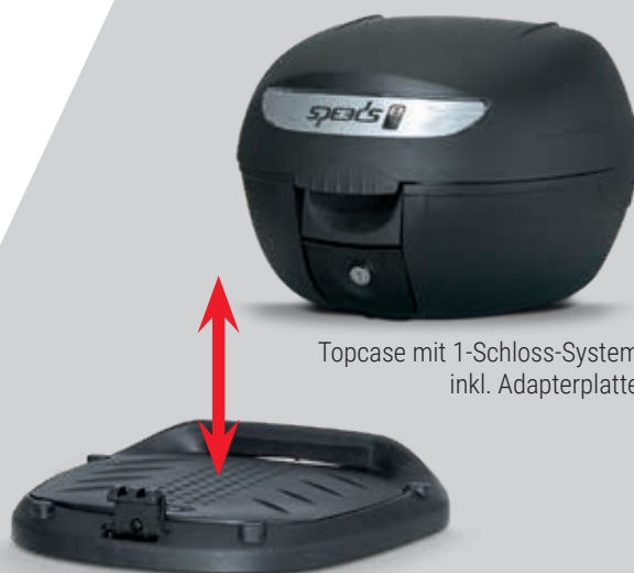
Topcase mit 1-Schloss-System inkl. Adapterplatte