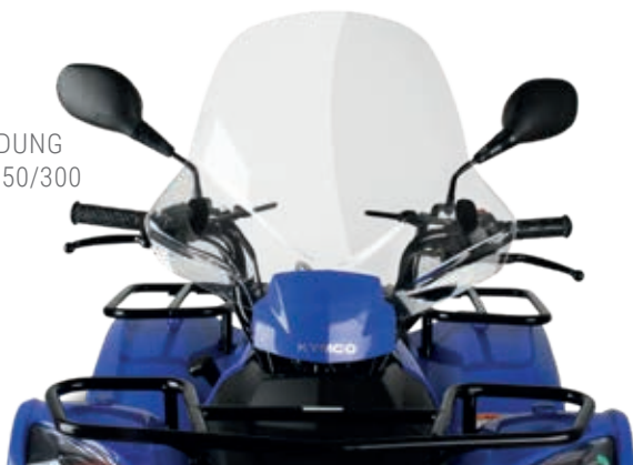
ABBILDUNG MXU 250/300