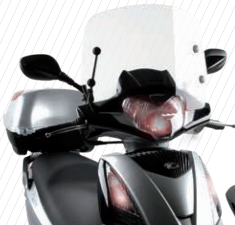
PEOPLE GT 125i/300i