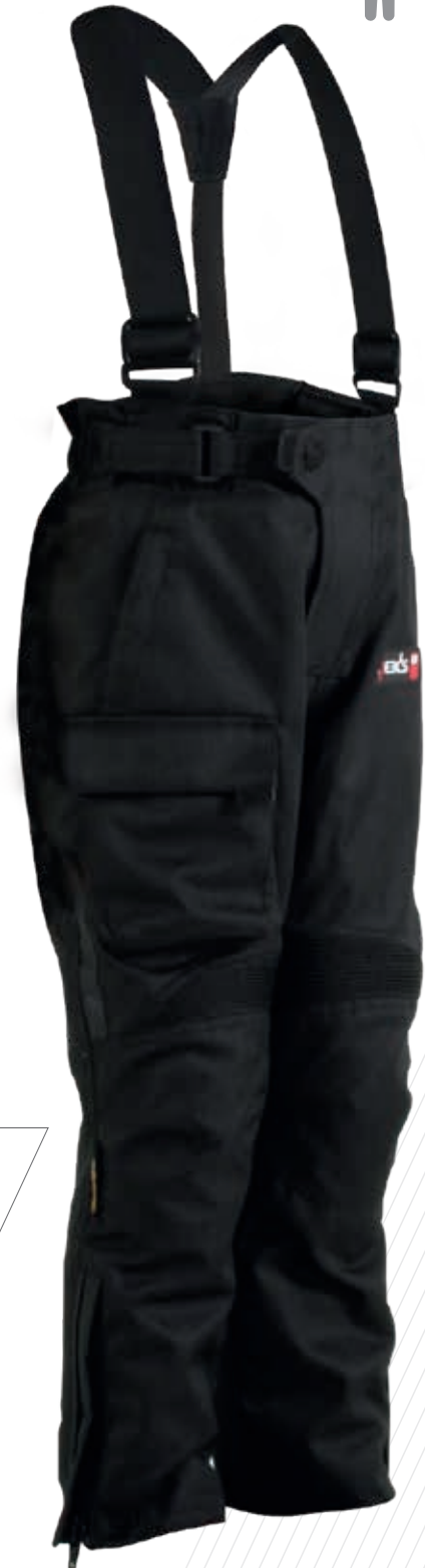
Reißverschluss zur Beinweitenverstellung