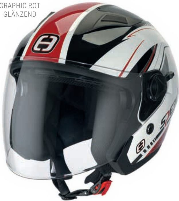
GRAPHIC ROT GLÄNZEND

GRATIS HELMSACK / GESICHERTE ERSATZTEILVERSORGUNG / GETÖNTE VISIERE OPTIONAL ERHÄLTICH